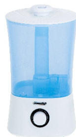
AIR HUMIDIFIER MS 7965