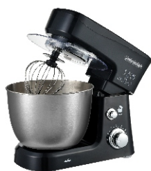
MIXER WITH BOWL MS 4217