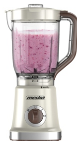
BLENDER WITH JAR MS 4079