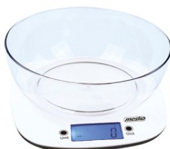
KITCHEN SCALE MS 3165