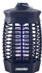
MOSQUITO KILLER LAMP MS 7933