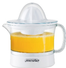
CITRUS JUICER MS 4010