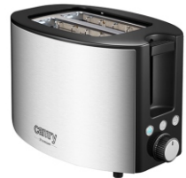
TOASTER 2 SLICES CR 3215