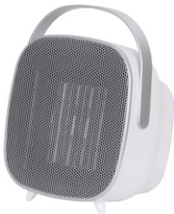
CERAMIC FAN HEATER CR 7732