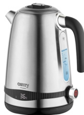
ELECTRIC KETTLE CR 1291