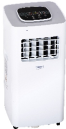
AIR CONDITIONER CR 7926