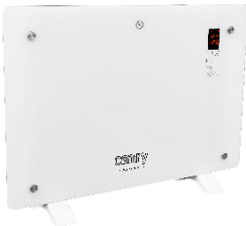
GLASS HEATER CR 7721