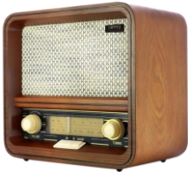
RETRO RADIO CR 1188