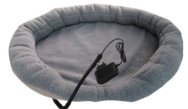
HEATED ANIMAL DEN CR 7431