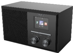
INTERNET RADIO CR 1180